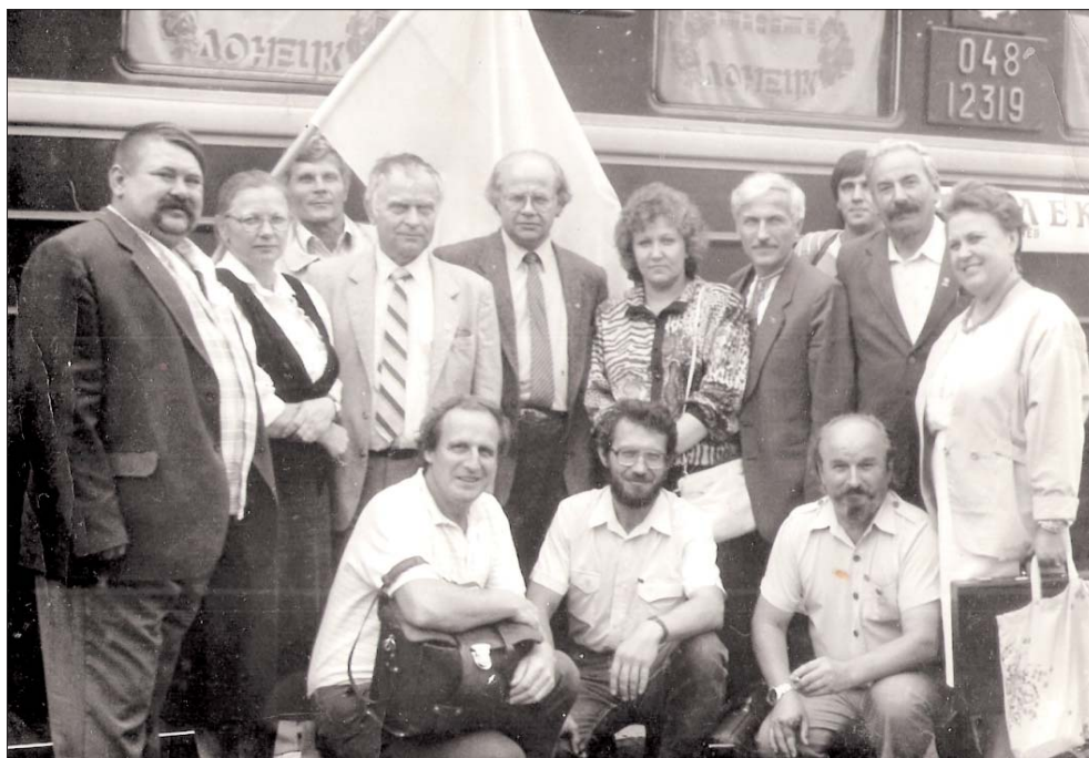
Учасники заснування Донецької обласної філії Української Гельсінської спілки.

На той час я вже був обраним головою обласного Товариства української мови ім. Тараса Шевченка, і мене з обкому КПРС (у той час органи компартії були