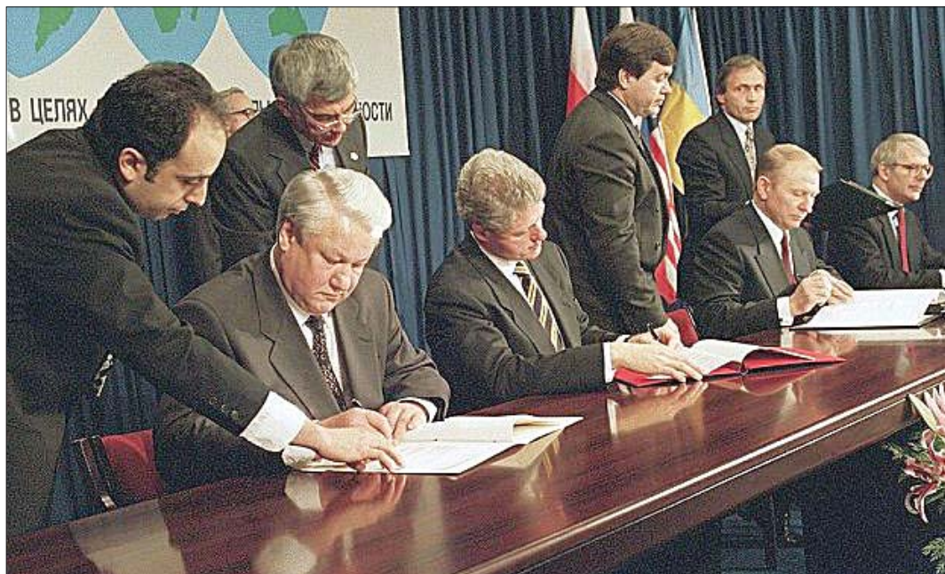
5 грудня 1994 року. Підписання Будапештського договору.

Росія поки що не готова говорити про де-