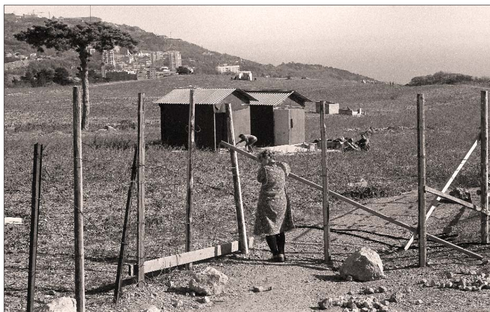
Серпень 1990 року. Кореїз, кримські татари повертаються з депортації.

Можливо, Л. Кравчук видав цей указ з метою уникнення війни з Росією, адже 7 квітня 1992 року президент РФ Єльцин видав указ «Про перехід Чорноморського флоту під командування РФ», що створювало передумови до можливого виникнення військового конфлікту, хоч і малоімовірного.