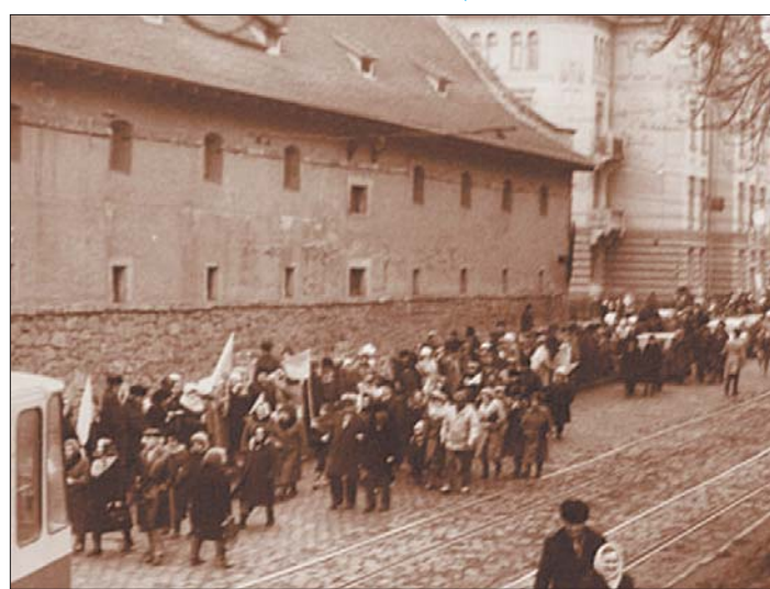
1990 рік. Живий ланцюг на вулиці Підвальной у Львові.

Квітень 2021 року — вперше в Україні пацієнтку з інфарктом з віддаленого Турківського району доставили гвинтокрилом до Львівської лікарні швидкої допомоги.