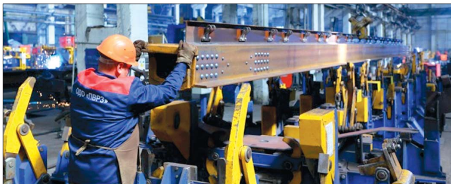
У виробничому цеху Попаснянського вагоноремонтного заводу.

У Попаснянському ВРЗ діє система менеджменту якості ISO 9001: 2008.