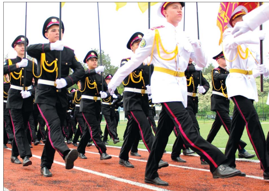
Урочистим маршем крокують курсанти Луганського обласного ліцею з посиленою військово-фізичною підготовкою «Кадетський корпус імені героїв Молодої гвардії».

Усі 104 випускники пройшли фахову підготовку й тепер готові до здобуття вищої освіти в навчальних закладах сектору оборони і національної безпеки.