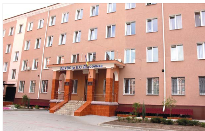
3 жовтня 2016 року Луганський державний університет внутрішніх справ імені Е. О. Дідоренка здійснює свою діяльність у Северодонецьку.