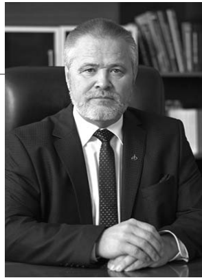
Голова Державного космічного агентства України Павло ДЕГТЯРЕНКО.