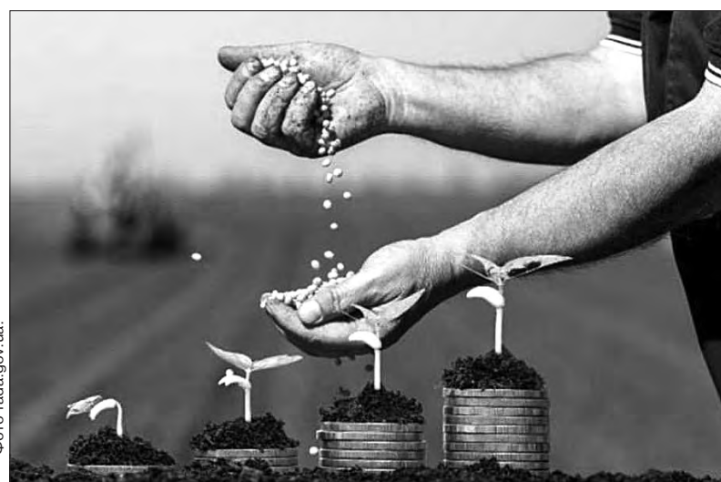
залежно від категорії кредиту та суб'єкта підприємництва.

Зазначається, що пільгове фінансування агровиробників за програмою «Доступні кредити 5-7-9» протягом 2024–2025 років є можливим завдяки підтримці Світового банку в рамках «Екстреного проекту надання інклюзивної підтримки для відновлення сільського господарства України (ARISE)». Програма спрощує доступ мікро- та малого бізнесу до банківського кредитування. Аграрії можуть отримати кредит у розмірі до 90 млн грн. Кредитування надається під 5–9% річних,