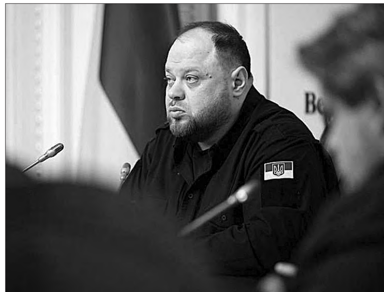
Прес-служба Апарату Верховної Ради України. Фото rada.gov.ua.

Насамкінець Голова Верховної Ради України зазначив, що завданням на сьогодні та найближчі дні є опрацювання внесених пропозицій