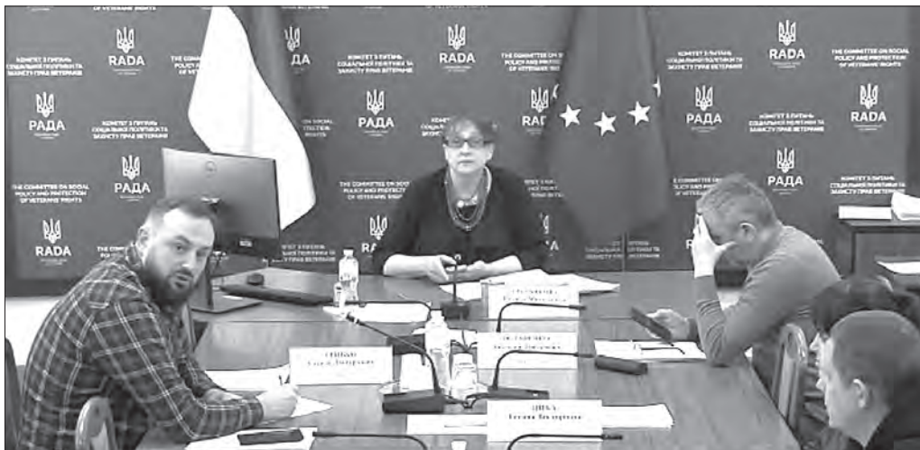
Скрін з відеозасідання комітету.

► встановлення заборони на прийняття рішень, наслідком яких є припинення підприємницької діяльності або скорочення