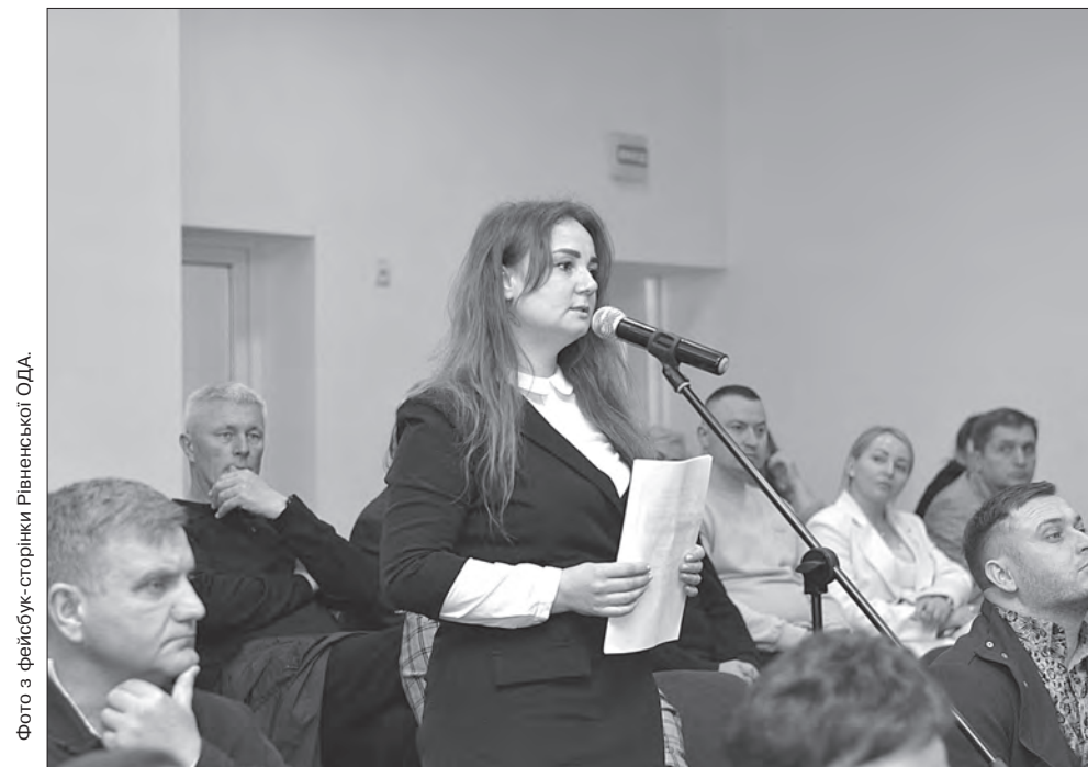
Фото з фейсбук-сторінки Рівненської ОДА.

Пресслужба Апарату Верховної Ради України.