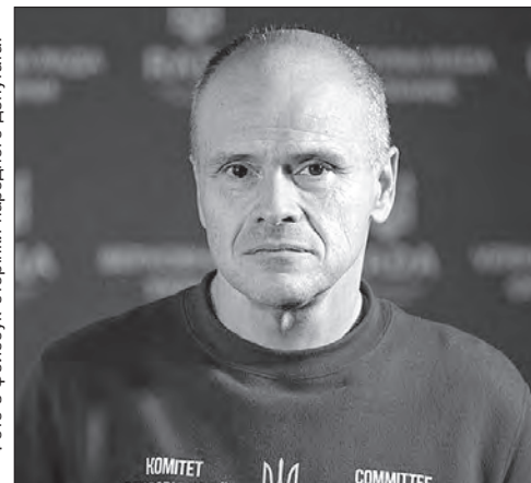
Фото з фейсбук-сторінки народного депутата.

Пресслужба Апарату Верховної Ради України.